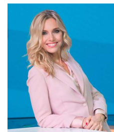
Conduce: Monica Marangoni